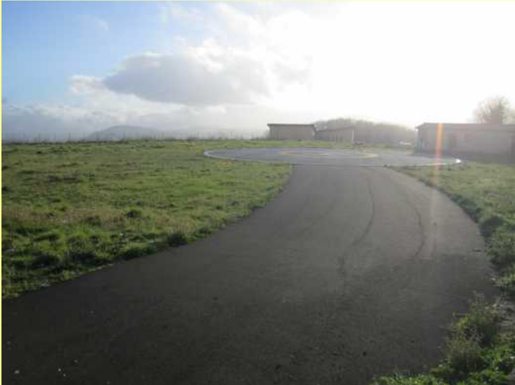
Foto area d' atterraggio