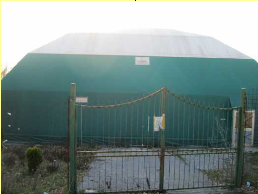
Foto Tenso Struttura