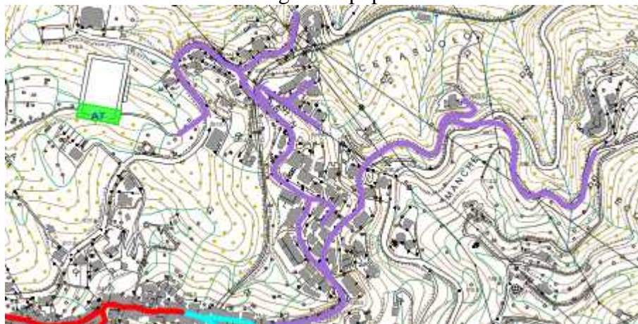
Area di attesa Popolazione