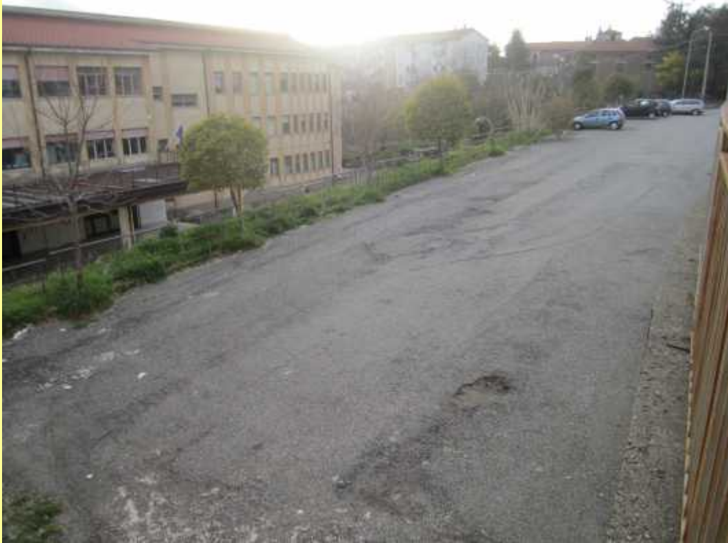
Foto 1 Area Parcheggio scuola Media