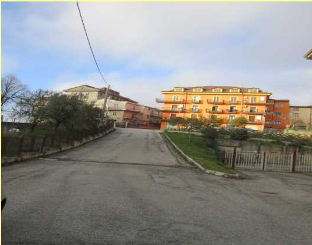
Foto 2 Ingresso scuola Media